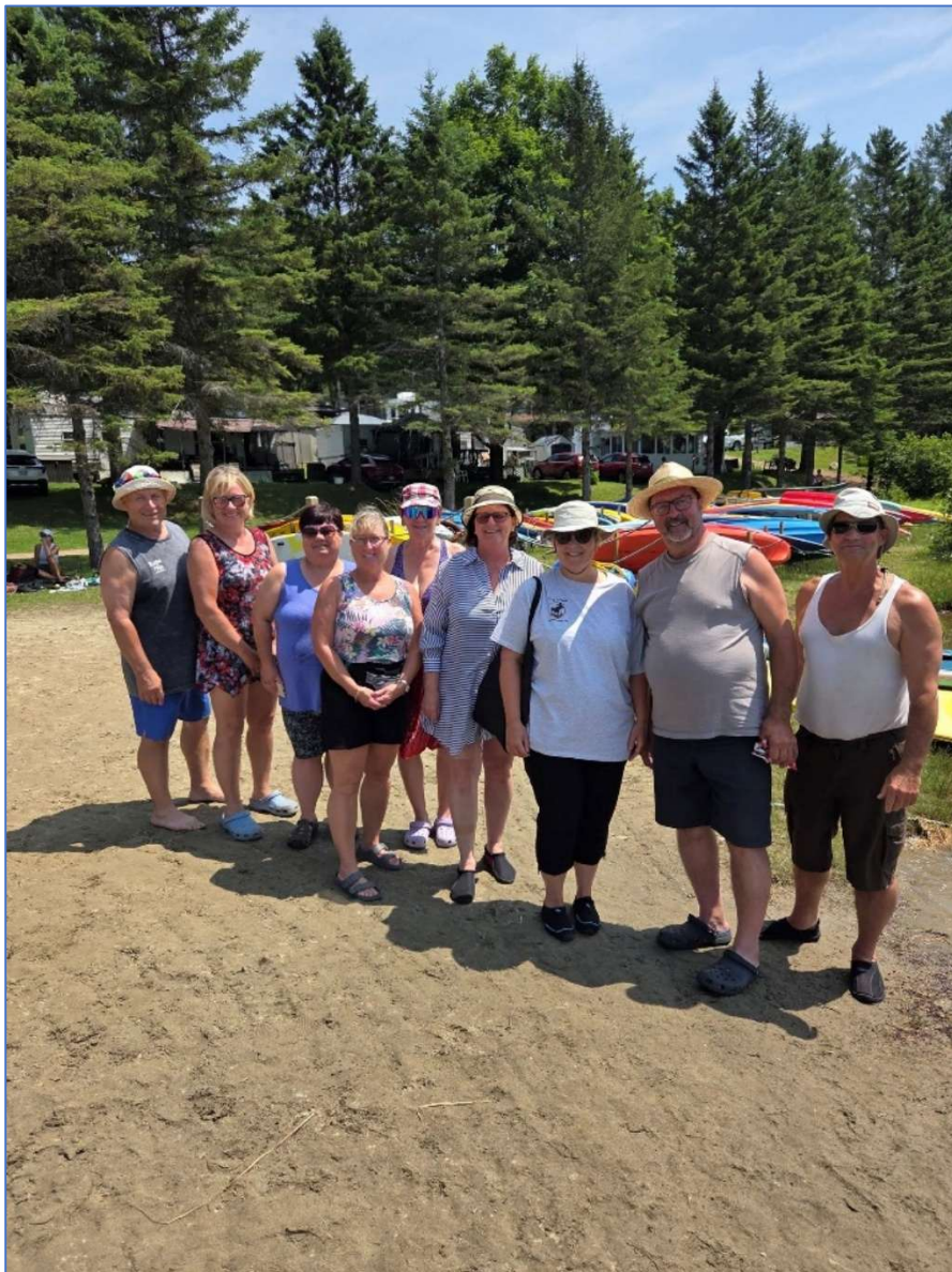
Les volontaires du Poker Run 2025

Le Poker Run a eu lieu le samedi 12 juillet autour du lac en embarcation non-motorisée. Nous avons eu un total de 63 participants de plus de 18 ans cette année. Merci au Camping d'avoir offert gratuitement une petite slush aux 13 enfants qui accompagnaient leur parent. Ce fût très apprécié par une journée ensoleillée. Une bonne coordination et la collaboration avec les propriétaires du Camping et la contribution des bénévoles du lac de l'Original et ceux du camping a contribué au succès de l'activité. Un total de 575,00 $ en prix a été partagé par les trois premières places. Cette la seule activité qui permet de réunir les propriétaires autour du lac avec les résidents du Camping Val-des-Bois sur le magnifique lac que nous partageons tous et permet de tisser des liens entre tous les riverains. Un gros merci et bravo à Denis Bénac et son épouse Lucie Smith, ainsi qu'à toute la grande équipe de volontaires bénévoles des stations ou ceux à la prise de photos.